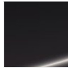
Galvanica nichel nero