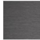
Satinato canna di fucile