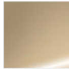
Galvanica oro champagne